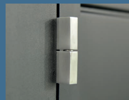
Gond finition inox brossé