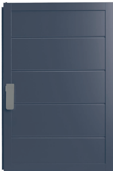
Quadra VB 170H