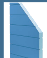
Panneaux sandwichs isolants de 30 mm