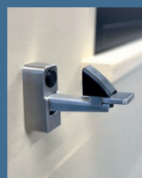
Arrêt à bascule en inox