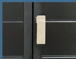
Crémone Invistyle©, une poignée pour une ergonomie d'ouverture en mode «push»